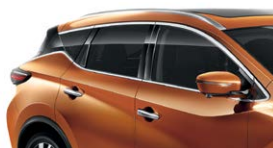
Оранжевый — EAW