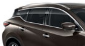
Серо-коричневый — CAM