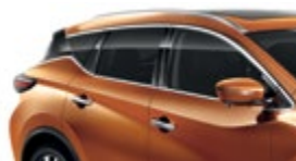
Оранжевый — EAW