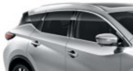
Серебристый — K23