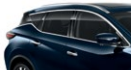
Темно-синий — RBG