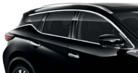
Черный — G41