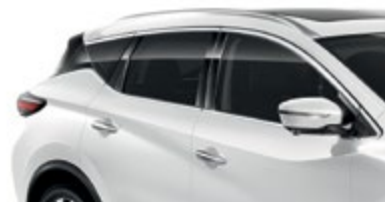
Белый перламутр — QAB