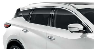
Белый перламутр — QAB