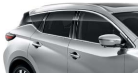
Серебристый — K23