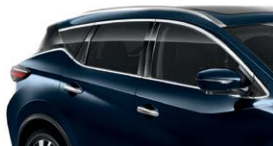
Темно-синий — RBG