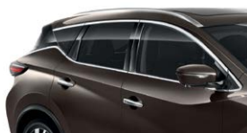
Серо-коричневый — CAM