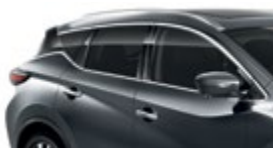
Темно-серый — KAD