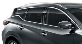
Темно-серый — KAD