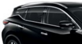
Черный — G41